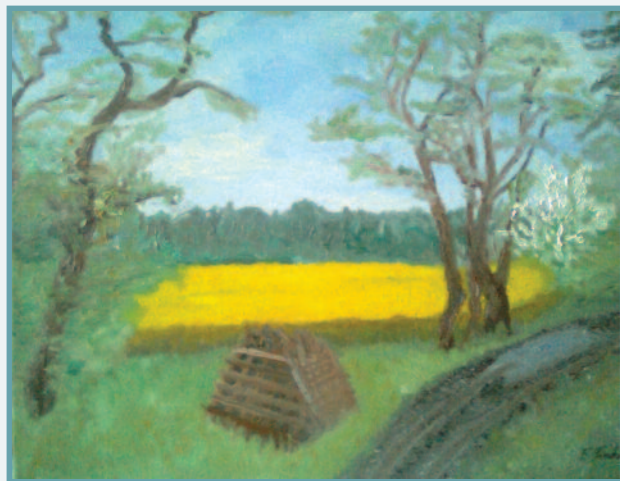
Jarná nádej ( lesík pri Jarovciach ) – 2013, olej na plátne ( Fedor Šimko )