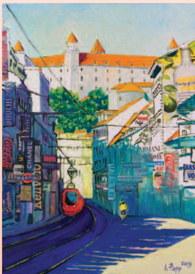
Obchodná ulica v Bratislave, 2014, koláž (Igor Papp)

Na dôchodku je od roku 2014 a plne sa venuje svojej záľube – maľovaniu. Kreslí a maľuje už takmer 50 rokov (od 15-tich rokov), s meniacou sa intenzitou vo svojich rôznych životných obdobiach. V jeho výtvarných technikách dominuje olejomalba, v neskoršom období akvarel, kresby tušom, grafika. V motívoch diel dominujú „klasické“ námety: zátišia s kvetmi, ovocím, motívy mesta, krása ženského tela... Doteraz mal v Bratislave štyri samostatné výstavy svojich prác - vo FN v Bratislave (2001), na GR SPP (2004 a 2006) a v Kláštore Milosrdných bratov v Bratislave (2014).